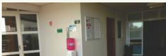
Reforma sala de lutas